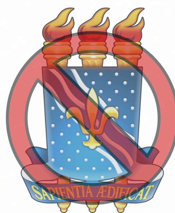
MODIFICAR AS CORES